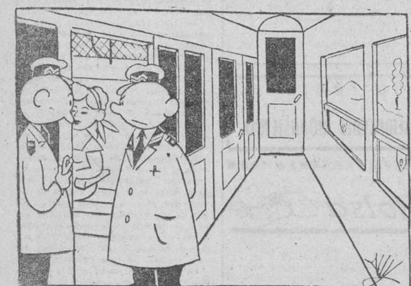
—Sí, lleva billete de tercera pero ella es «de primera»