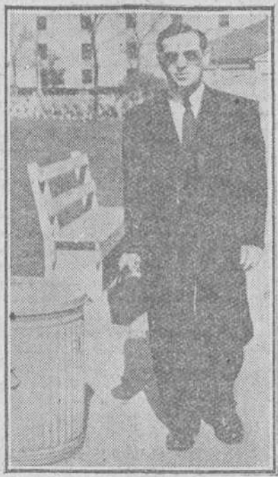
Un ciego se dirige a su lugar de trabajo provisto de la "linternas sonora".

WASHINGTON. (Especial para DIARIO DE BURGOS)