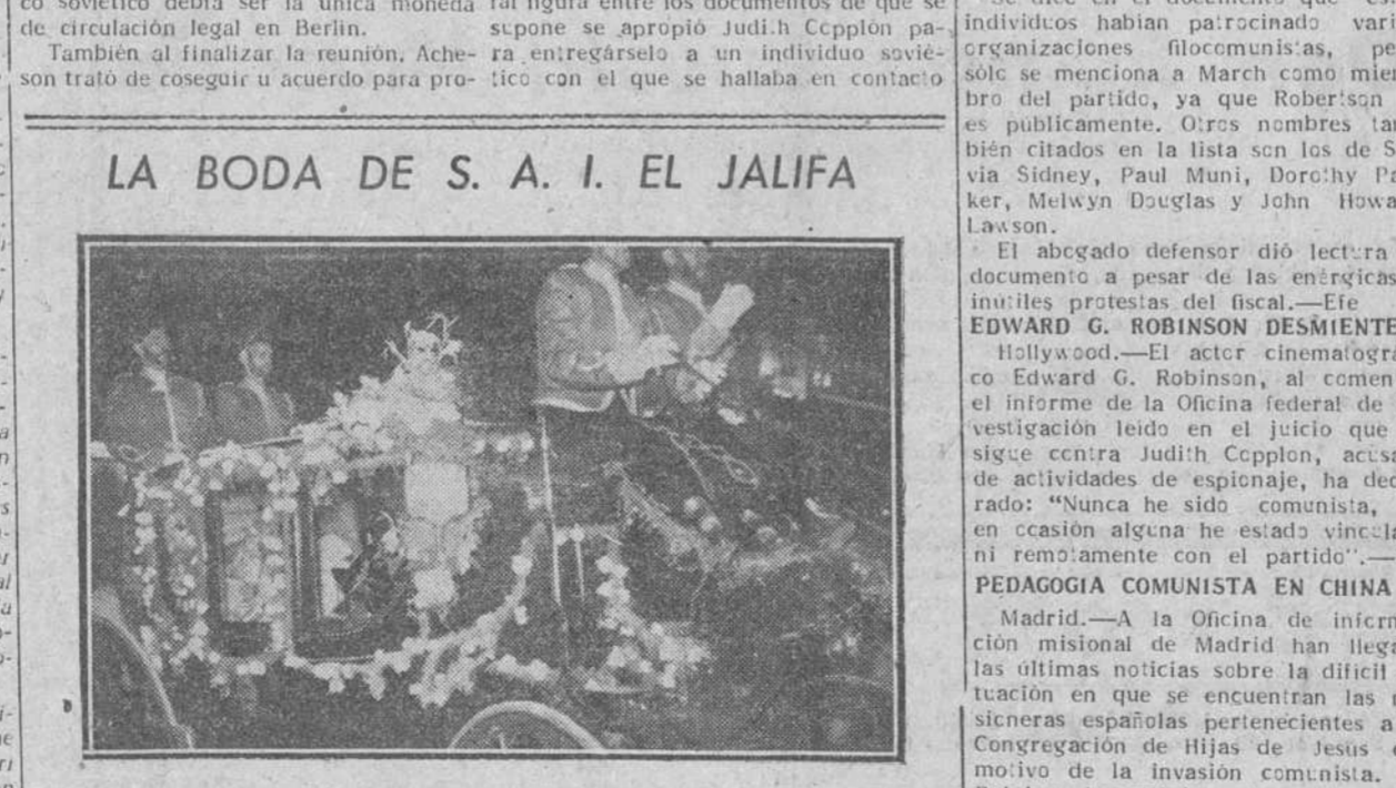
Tetuan.—La carroza nupcial conduciendo a la Princesa en el momento de entrar en el Palacio del Mexuar, residencia de S. A. I. el Jalifa.