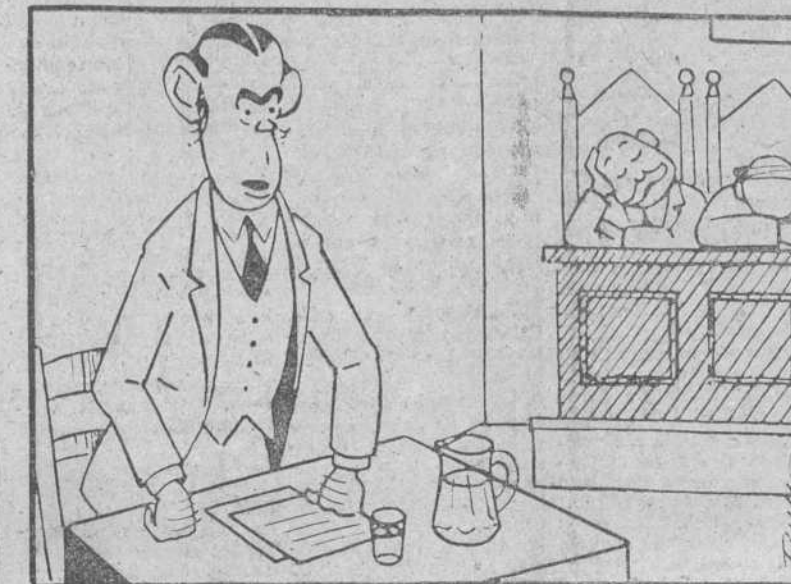
— Las diferencias entre el hombre y el mono... —