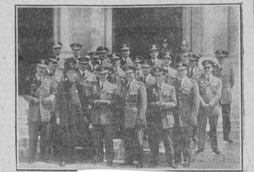
Ayer llegó a Burgos el cuadro de mandos de la Milicia Aérea en nuestra ciudad. En nuestra foto aparecen acompañados de los señores de la salida del Palacio de la M. A. U.