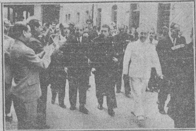
Barcelona. — S. E. el Jefe del Estado, a su llegada a la Escuela Industrial que visitó detenidamente y fué aclamado entusiastamente por los aprendices de dicho Centro.