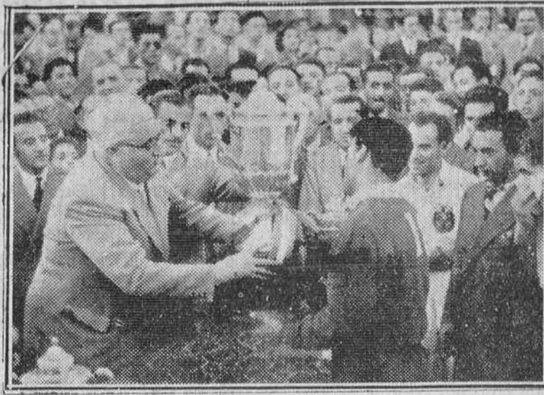
El teniente general Yagüe entregando a Argote, preparador del equipo español de boxeo de la Sociedad Deportiva Militar, el magnifico trofeo por el donado y que se adjudicó el conjunto español por su mayor número de victorias sobre la selección francesa, en la magna velada pugilistica celebrada el domingo en la Plaza de Toros.