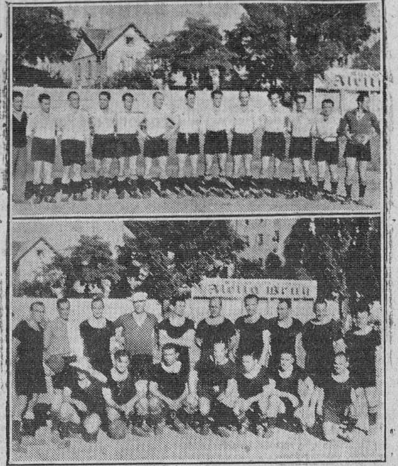
Un evocador partido de fútbol (de homenaje al teniente general Yagüe) se celebró ayer en Zatorre, entre los equipos formados por «Viejas glorias» del fútbol español, reunidas en nuestra ciudad, con motivo del Cursillo Nacional de Preparadores. En nuestras «fotos»: arriba, el equipo «cantábrico». Abajo, los componentes del cuadro «mediterráneo».