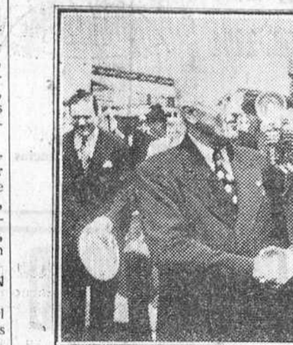
Washington. -- Después de haber participado en las deliberaciones de la Junta de Ministros de Asuntos Exteriores, el secretario de Estado, Dean Acheson, regresa a Washington, donde es saludado en el aeropuerto por el propio presidente Truman.