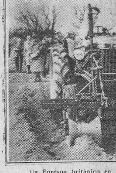
Un Fordson británico en trabajos de laboreo.