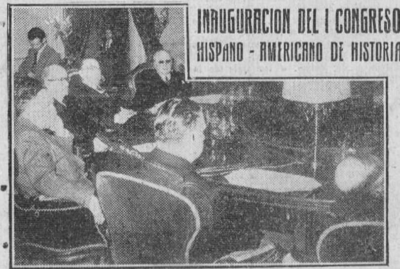
Madrid.—El delegado permanente del Perú en la O. N. U., don Víctor Andrés Belaunde, ministros españoles de Asuntos Exteriores y Educación Nacional, así como otras personalidades, en la presidencia del acto de inauguración del I Congreso Hispano-Americano de Historia celebrado en el Palacio del Senado.