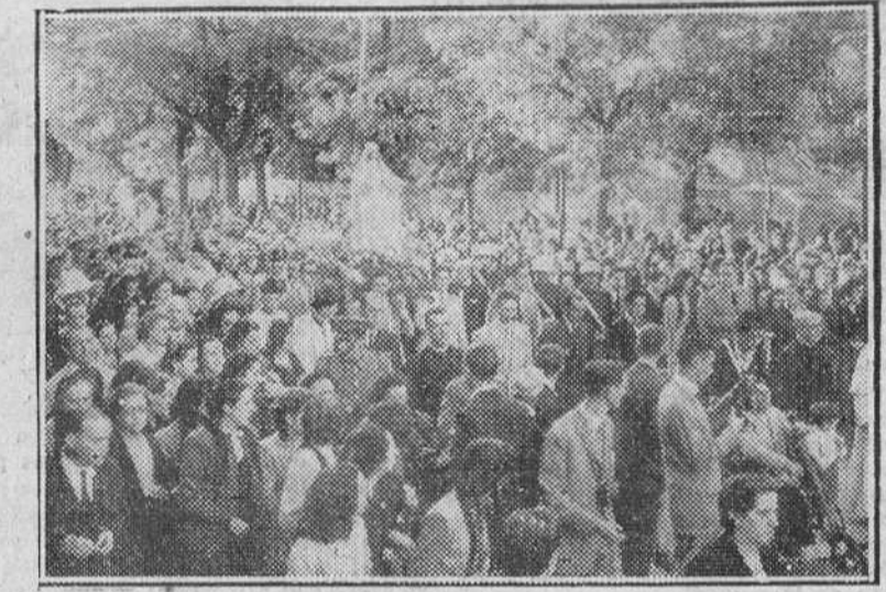
Madrid.—Una enorme muchedumbre acompaña a la Santísima Virgen de Lipo, que fue procesionalmente trasladada desde la Legación Filipina al templo de la Inmaculada Concepción.