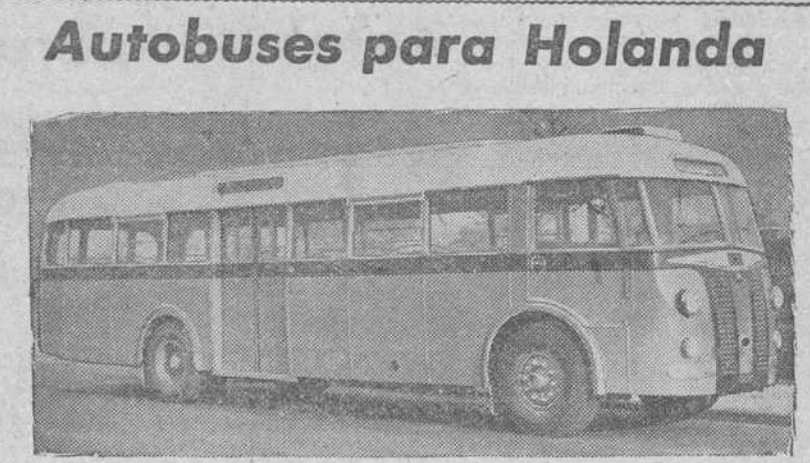
Uno de los 150 autobuses que una importante Casa automovilística norteamericana, ha construido con destino a la Compañía de ferrocarriles holandeses. Toda la carrocería es metálica y está dotado de motor con cinco velocidades. El vehículo es capaz para 60 pasajeros y las puertas se abren y cierran automáticamente.

¿Quién puede pensar despasionalmente, que la participación de España no es indispensable y urgente para vigorizar las fuerzas espirituales y materiales que es preciso tener preparadas y organizadas para asegurar la paz y prosperidad colectivas, y a la vez, contribuir a detener el peligro de dominación que nos viene de Oriente y que produce el estado de inquietud y permanente postergación en que vive hoy el Mundo?" "Nada ni nadie puede soslayar la presencia y la huella de España en la Historia, ni olvidar su misión de for-