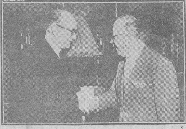
Roma. — Un momento de la entrevista del ministro español de Educación Nacional, señor Ibáñez Martín, con el ministro de Instrucción Pública de Italia, Sr. Gonella, en el despacho oficial del último.

El ministro español contestó a las palabras del rector con otras muy brillantes llenas de calor y cordialidad. Dijo que dentro del área de la cultura del Mundo, Italia y España estarán siempre presentes.—Efe.