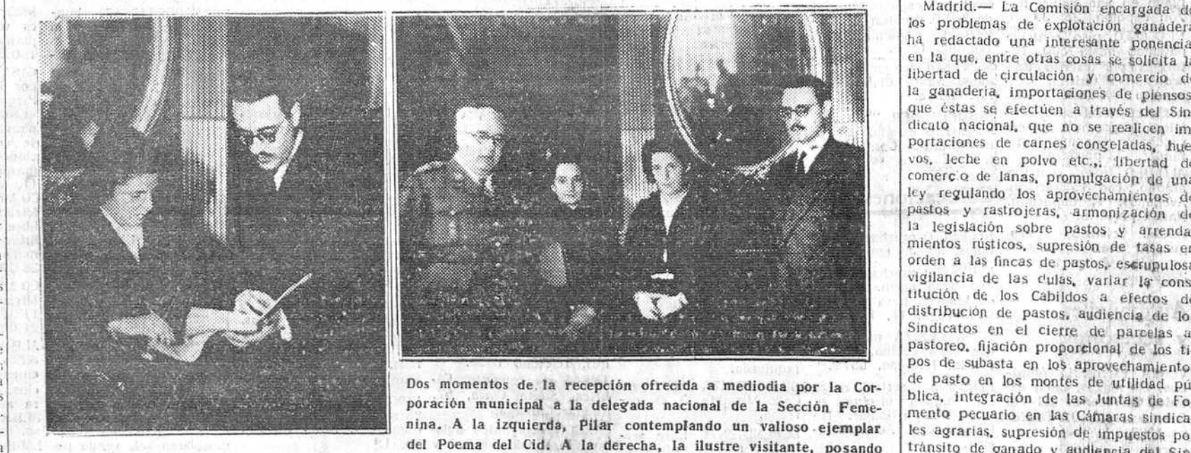
Dos momentos de la recepción ofrecida a mediodía por la Corporación municipal a la delegada nacional de la Sección Femenina. A la izquierda, Pilar contemplando un valioso ejemplar del Poema del Cid. A la derecha, la ilustre visitante, posando para DIARIO DE BURGOS, acompañada por el teniente general Yagüe, el alcalde de la ciudad y la delegada provincial de la Sección Femenina.