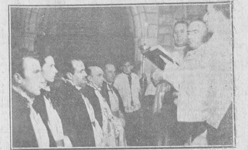
Un momento del solemne acto celebrado en la iglesia parroquial de San Gil Abad, con motivo de la imposición de hábito y entrega del título de Hermano Mayor de la Real Hermandad de la Sangre del Santísimo Cristo de Burgos al gobernador civil y jefe provincial del Movimiento don Alejandro Rodríguez de Valcárcel.

El gobernador civil, Hermano Mayor de la Cofradía de "Las Santas Gotas"