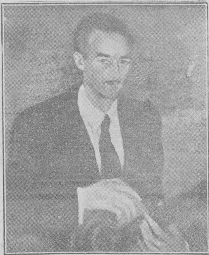
Entre los últimos retratos que el artista Modesto Ciruelos tiene hechos, figura éste de Regino Sainz de la Maza, en el que, a través de una magnífica captación psicológica, ha conseguido un acierto pleno de espiritualidad, siendo muy elogiado por las más destacadas personalidades intelectuales que desfilan por el estudio del ilustre guitarrista en Madrid.