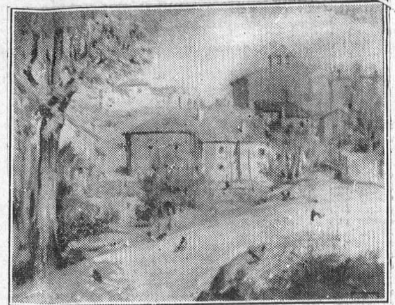
Paisaje titulado "Sarracin", obra del laureado pintor don Marceliano Santa María.

Cada año, el laureado pintor burgalés don Marceliano Santa María, cuando se acerca el verano, recobra una alegría y un vigor excepcionales. Su estudio de la calle de Abel parece desajarse, mientras el octogenario artista febrilmente efectúa los preparativos de su viaje a Burgos. Y cuando el momento llega, la penumbra de aquel helado contraste con la profunda emoción de su propietario.