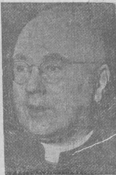
(Pasa a última página) MONSEÑOR SPELLMAN