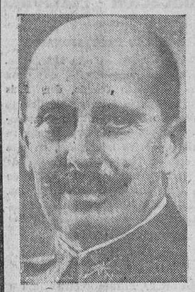
Ayer llegó a esta ciudad de paso para Liérganes, el ministro del Ejército. El ilustre paisano nuestro, teniente general Dávila, hospedándose en el Hotel España.