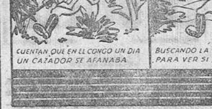
UNA HISTORIA DE LA SELVA