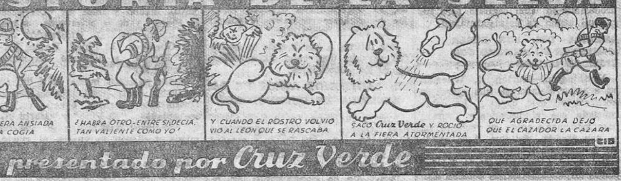
UNA HISTORIA DE LA SELVA

Orujo especial Anisados finos y licores del Coñacs