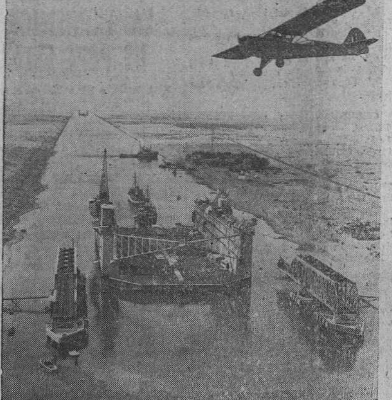
UN DIQUE CONSTRUIDO POR LOS INGLESES EN BOMBAY, PARA SER UTILIZADO POR LA MARINA BRITANICA EN MALTA. FUE REMOLCADO RECIENTEMENTE A TRAVES DEL CANAL DE SUEZ POR SU EXCESIVO TAMAÑO (PUEDE ACOMODAR A UN BARCO DE 50.000 TONELADAS) TUVO QUE SER CORTADO EN DOS PARA PASAR POR EL CANAL. EN LA FOTOGRAFIA VEMOS UNA DE LAS PARTES DEL DIQUE AL PASAR POR LAS ESCALAS. SOBRE EL, VUELA UN AVION DE LA R. A. F. AL FONDO, EN LONTANANZA, SE DIVISA LA OTRA MITAD DEL DIQUE.