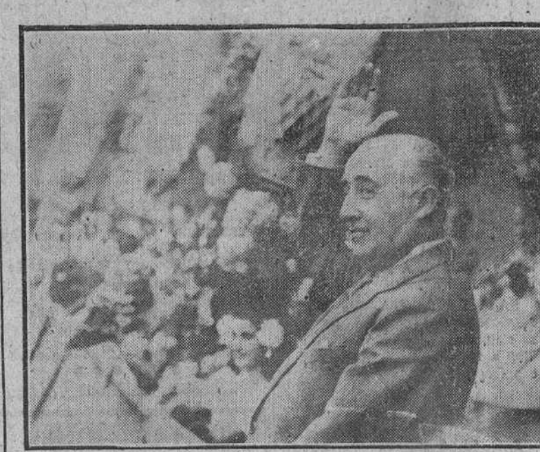
San Sebastián.— S. E. el Jefe del Estado, acompañado de su esposa e hija, asiste a la primera corrida de feria. El Caudillo saluda desde su palco al público que le aclama.