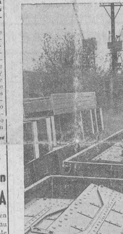
Los primeros materiales que envía la U. N. R. R. A. a China, se embarcan en el puerto inglés de Tilburg. Se trata de piezas prefabricadas para la construcción de puentes

Winston Churchill invita a sus correligionarios a trabajar para descubrir al pueblo los peligros de la política laborista