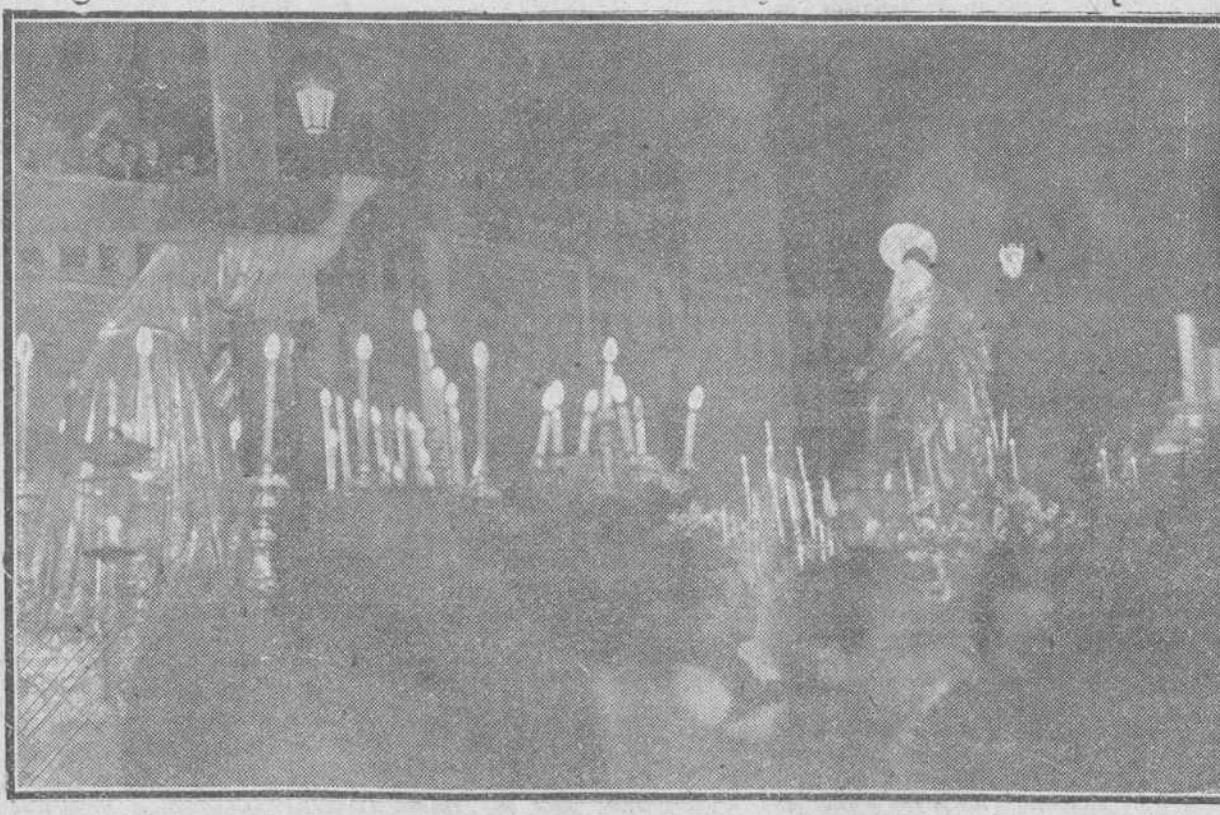
En la noche del Jueves Santo, se celebró por vez primera en nuestra ciudad la solemne y conmovedora procesión de «El Encuentro». Nuestra foto recoge el momento en que los pasos de «Cristo con la Cruz a cuestas» y de «Nuestra Señora de los Dolores», llegan a la plaza del Duque de la Victoria, situándose al pie de la Catedral

Burgos entero ha participado en la conmemoración de los sacrosantos misterios de la Redención del género humano.