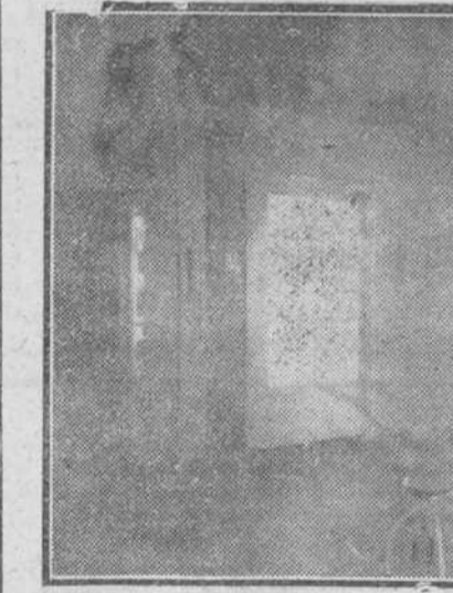
Detalle de uno de los quirófanos del nuevo Dispensario.

Expuestas en líneas generales las características del edificio, veamos ahora cómo éste se halla distribuido. Con ser en su aspecto residencial completo y magnífico dicho Cen-