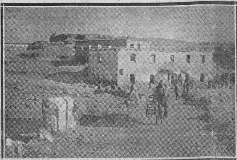
ALCALA DE HENARES. LA EXPLOSION DE UN POLVORIN EN EL CERRO DEL PREDIO "ZULEMA", CERCANO A ALCALA DE HENARES OCASIONO DIEZ MUERTOS Y UNOS TREINTA Y CINCO HERIDOS, ADEMAS DE BASTANTES PERDIDAS MATERIALES. LA FOTO REPRESENTA UNA VENTA CERCANA AL CITADO POLVORIN. LAS FUERZAS DEL EJERCITO DESPUES DEL SALVAMENTO DE PERSONAS, SE DEDICAN AL DESCOMBRO DE MUEBLES Y ENSERES