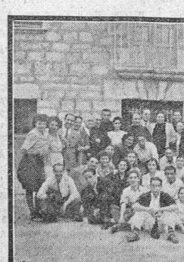
Un grupo de orfeonistas, captados por nuestro fotógrafo, en el pueblo de Ubierna al que el Orfeon Burgalés efectuó el domingo último, su anual excursión recreativa.