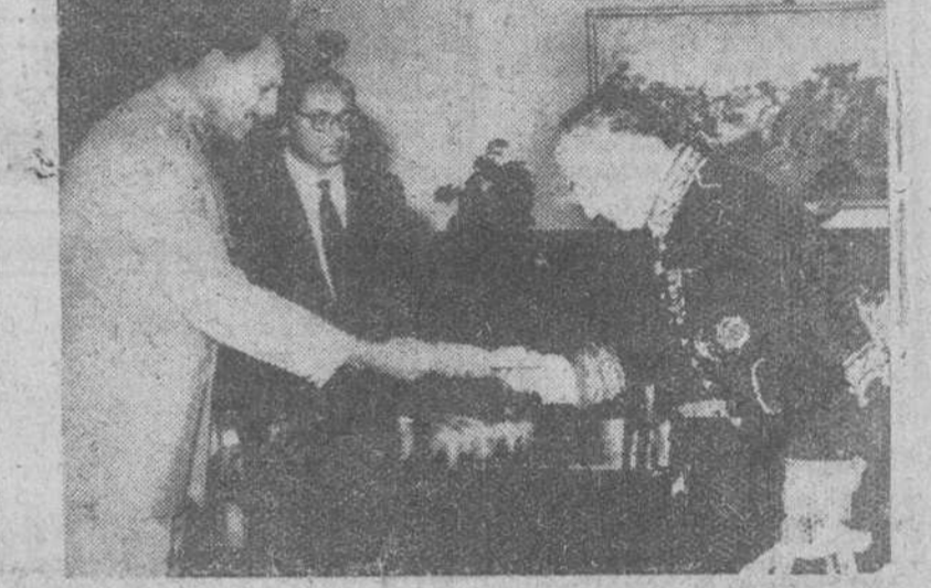
Karachi (Pakistán).— El embajador español en el Pakistán, Marqués de Orellana la Vieja, en el momento de hacer entrega de sus cartas credenciales al presidente del Pakistán, general Mohammad Ayub Khan acompañado de su ministro de Asuntos Exteriores, M. Manzor Qadir, en la ceremonia celebrada en el Palacio presidencial.