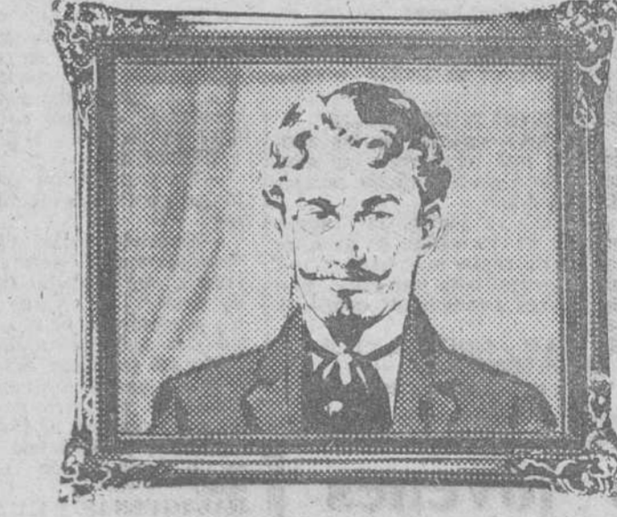
Luego sus abuelos...

Y después sus padres... ¡Ya preferían ANTIU-XIXONA porque tiene "sabor de Navidad"