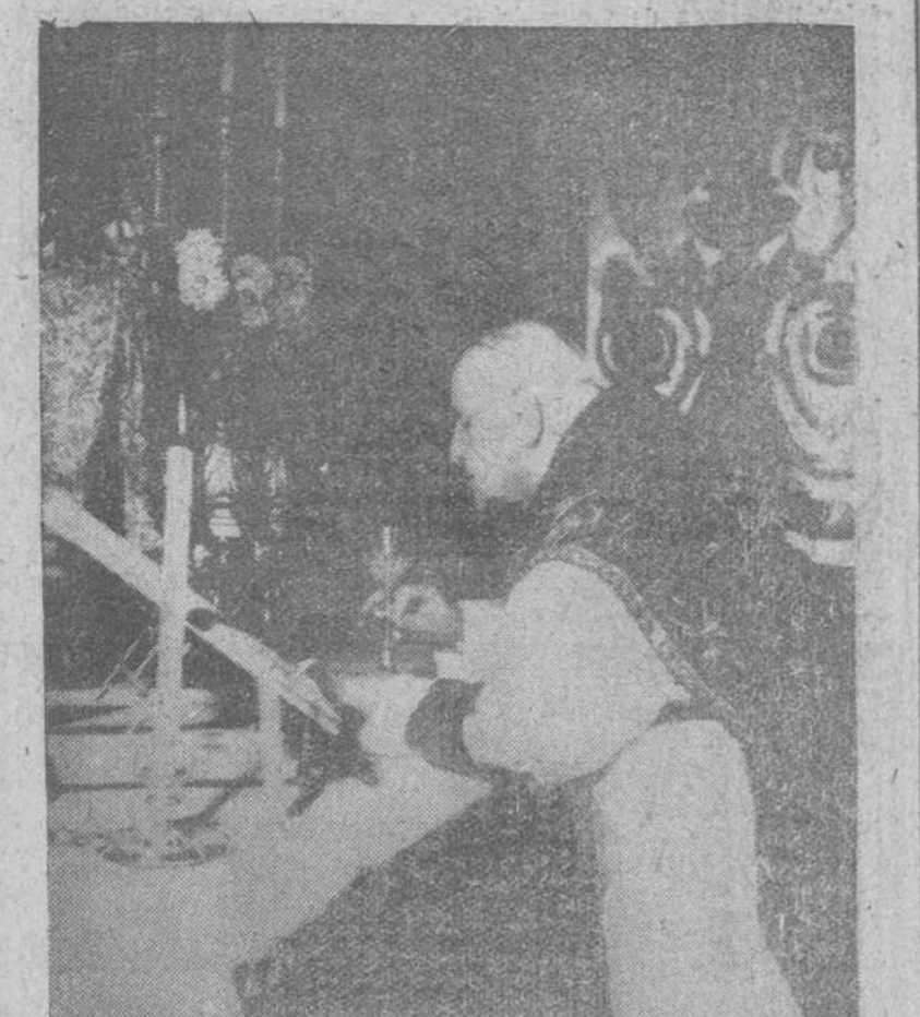
Ciudad del Vaticano.— Con motivo de su 77 cumpleaños, S. E. el Papa Juan XXIII, celebra el santo oficio de la Misa en su capilla privada.