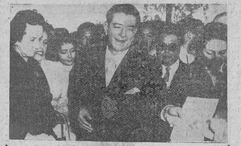
Méjico.— El candidato presidencial Adolfo López Mateos —centro— del partido Revolucionario Institucional, en el momento de emitir su voto. López Mateos fue elegido por gran mayoría de votos como presidente de la República.