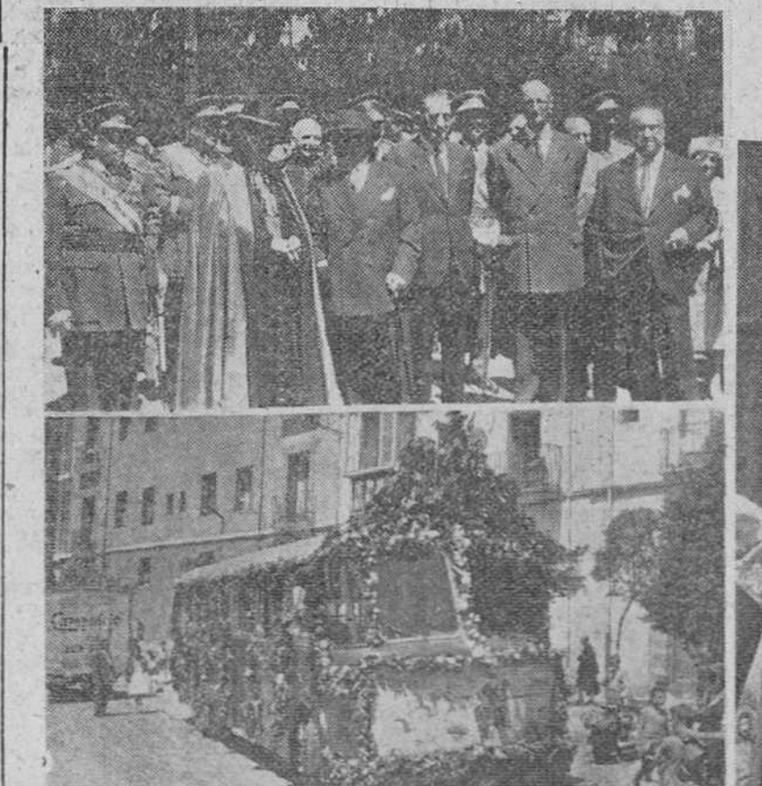
Tres documentos gráficos de los actos celebrados ayer en nuestra ciudad, con motivo de la festividad de San Cristóbal. En la parte superior, a la izquierda, las autoridades, a la salida de la Misa celebrada por el Cuerpo de Automovilistas en la iglesia de la Merced. A la derecha, el excelente señor Arzobispo, durante la bendición de los coches situados en la plaza del Rey San Fernando, al final del acto religioso celebrado en la S. I. Catedral por la Beneficencia de Conductores Mecánicos. Finalmente, en segundo plano, uno de los coches engalanados del Servicio Municipal de Autobuses, al que fue concedido el trofeo instituido para ómnibus.

Sin embargo, el nuevo antibiótico no tiene ningún efecto sobre otros gérmenes tales como el streptococcus.