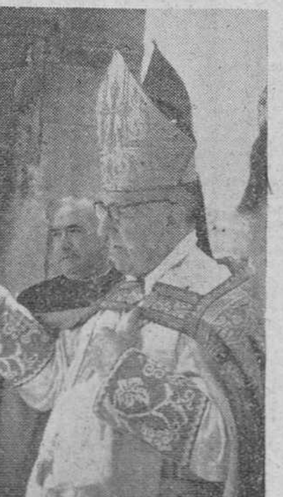
Tres documentos gráficos de los actos celebrados ayer en nuestra ciudad, con motivo de la festividad de San Cristóbal. En la parte superior, a la izquierda, las autoridades, a la salida de la Misa celebrada por el Cuerpo de Automovilistas en la iglesia de la Merced. A la derecha, el excelente señor Arzobispo, durante la bendición de los coches situados en la plaza del Rey San Fernando, al final del acto religioso celebrado en la S. I. Catedral por la Beneficencia de Conductores Mecánicos. Finalmente, en segundo plano, uno de los coches engalanados del Servicio Municipal de Autobuses, al que fue concedido el trofeo instituido para ómnibus.