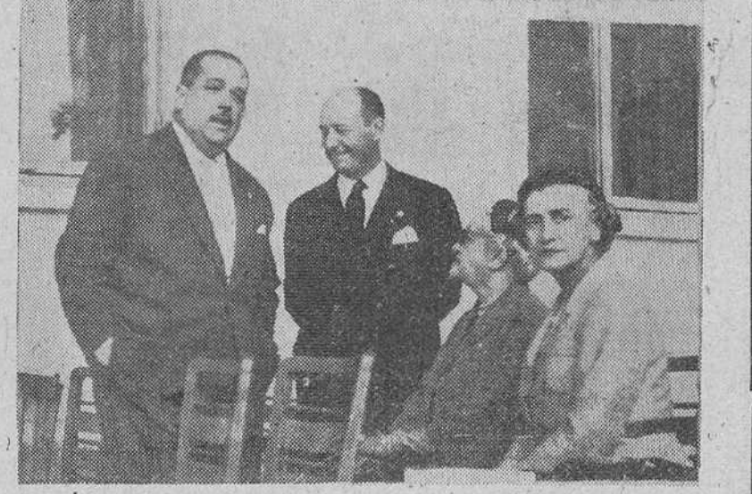
El alcalde de Madrid conversando con el de Burgos en el campamento aeródromo de Villafria, en el curso de los actos celebrados ayer con motivo de la entrega de despachos en la Milicia Aérea Universitaria.