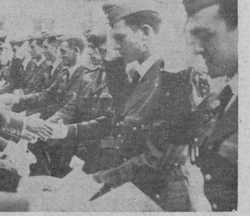
Con la acostumbrada solemnidad se celebró ayer la entrega de despachos a los nuevos oficiales de la M. A. U., acto del que damos cuenta en sexta página. En las precedentes placas, dos momentos de la ceremonia: intercambio de estandarte y entrega de despachos.

Con la acostumbrada solemnidad se celebró ayer la entrega de despachos a los nuevos oficiales de la M. A. U., acto del que damos cuenta en sexta página. En las precedentes placas, dos momentos de la ceremonia: intercambio de estandarte y entrega de despachos.