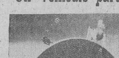
Seattle (Estados Unidos). — Dos científicos de la "Bosong Airplane Company" observan la maqueta del vehículo que han proyectado para realizar reconocimientos del planeta Marte. Este vehículo pesaría menos de 300 kilos y tendría un tamaño de doce metros. Habría de ser lanzado desde una estación-satélite que circunvalase la Tierra a una altura de, por lo menos 650 kilómetros, tomando su fuerza motriz del Sol, mediante un acelerador de iones. Después de realizar su misión de reconocimiento, este vehículo regresaría al satélite terrestre desde el que fue lanzado.