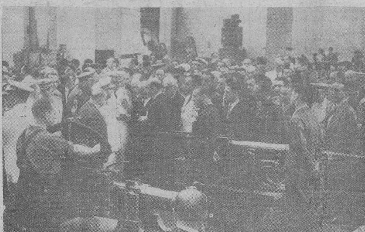
Franco visita la fábrica "Placencia de las Armas" Andacaj (Guzpuzcoa).— Acompañado por los ministros del Ejército, Marina y Subsecretario de la Presidencia y otras personalidades, Su Excelencia el Jefe del Estado, recorre las instalaciones de la fábrica "Placencia de las Armas", situada en esta población. En esta fábrica, inaugurada en Agosto de 1944, se construyen cañones, piezas para locomotoras eléctricas y otros elementos para armamentos de guerra.

Se cree que el ministro de Asuntos Exteriores de Islandia, aceptará la propuesta de someter el caso al criterio del Tribunal Internacional de Justicia de La Haya.—Efe.