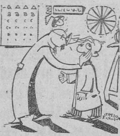
—Tiene usted este ojo completamente distinto al de Guareña... (No encuentro nada!) (De "El Comercio", de Gijón).

Ante el temor de que la preocupación que existía en el campamento se extendiera a la ciudad, preferimos silenciar la noticia en espera de que se encontrara pronto a los indicados turistas, como felizmente ha ocurrido, sin que se registrara ningún lamentable percance. Ahora bien, pasado pues el trance difícil, ofrecemos a los lectores la correspondiente información, llegada a nosotros, como el resto de nues-