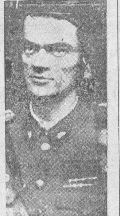
El general Pal Maletier, héroe de la revolución húngara

Hay otro motivo que ha inspirado también la decisión de Kadar: la entrega a la ONU por el príncipe Wan, del informe de su misión fracasada en Hungría. La ONU pidió a este diplomático que se trasladara a Budapest, con el fin de obtener si era posible la retirada de las fuerzas soviéticas y la organización de elecciones libres. Naturalmente, Kadar le impidió poner el pie en territorio húngaro y de mezclarse en asuntos que "no le interesan". Kadar pretende ahora vengar una vez más a las Naciones Unidas. No será solamente la cabeza del comandante Palavicini la que caiga. Dentro de poco será juzgado el general Maletier y no cabe duda de que morirá también. Todo para que Kadar se mantenga.