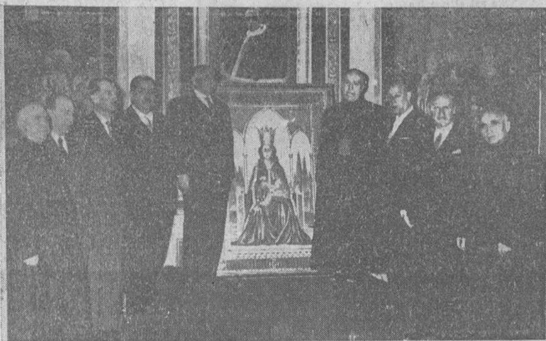
Según es tradicional, ayer, festividad de la Epifanía del Señor, obsequió nuestro Rvdo. Prelado con un almuerzo a las primeras autoridades locales. En la precedente placa, figuran los concurrentes a dicho acto.