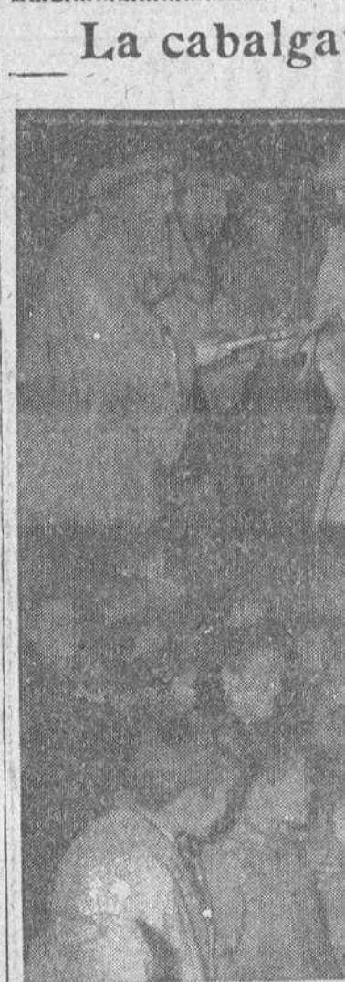
El cautivador cortejo de los Reyes Magos, desfiló a última hora de la tarde por calles de la ciudad, incluyendo el reparto de juguetes en la propia Casa Consistorial. Al llegar el cortejo a la Plaza Mayor, los Monarcas se apearon de sus cabalgaduras, recibiendo las llaves simbólicas de la ciudad, momento que recoge la primera placa de nuestro reportaje gráfico. En la otra, aparece uno de los Monarcas saludando afectuosamente a un niño.