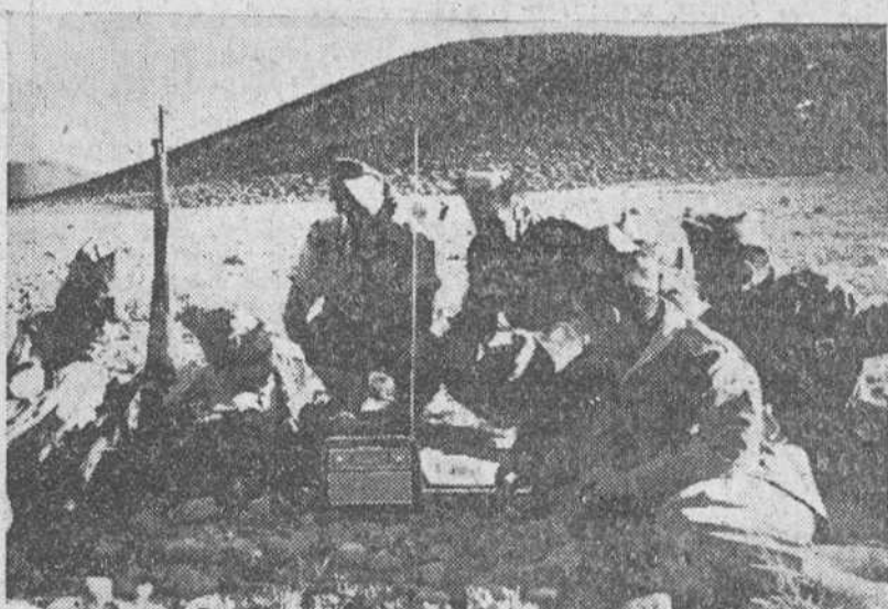
Sidi Ifni.— Tropas de la Legión escuchan la radio por medio de los receptores recibidos de la Península en sus posiciones de primera línea.