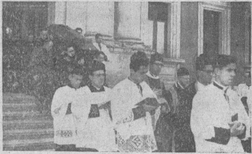
Ayer se celebró el sepelio del Rvmo. Padre Marcelino Lardizábal, vicario general del EME, piadoso acto del que damos cuenta en otro lugar de este número. En la fotos obtenida por Cifra, se recoge el momento en que el féretro que contenía los restos del benemérito misionero era sacado del Seminario a hombros de un grupo de seminaristas