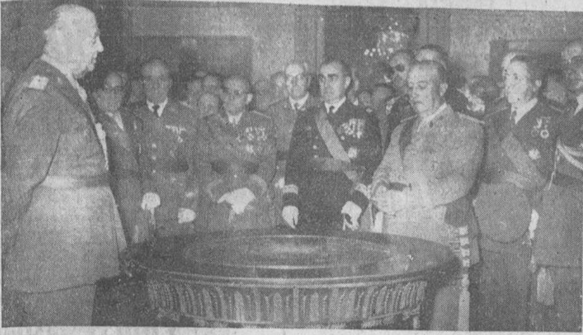
El Pardo. Su Excelencia el Jefe del Estado con los ministros y altos jefes de los Ejércitos de Tierra, Mar y Aire que le felicitaron con motivo de la Pascua Militar.

EE. UU. no desean un pacto de "no agresión" con Rusia hasta después de resolver los problemas específicos entre el Oriente y Occidente