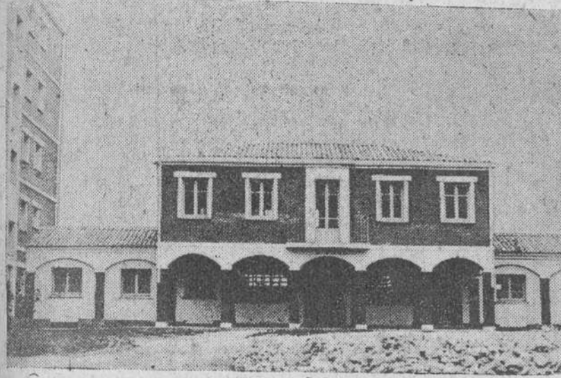
Vista de la fachada principal de las Escuelas que la Caja de Ahorros Municipal acaba de construir en Los Niveles