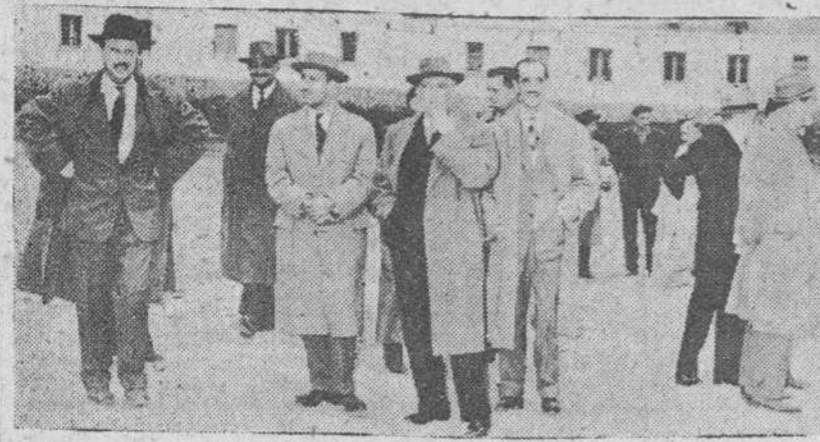
Un momento de la visita efectuada ayer por el Consejo de Gobierno a la Ciudad de la Caja de Ahorros Municipal

Esperaban su llegada los arquitectos de los distintos blo-