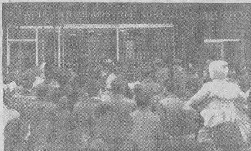
UN GRAN ACONTECIMIENTO CONSTITUYO EN BRIVIESCA LA INAUGURACION DE LAS MODERNAS OFICINAS DE LA CAJA

Próximo establecimiento de nueva Agencia en Miranda de Ebro