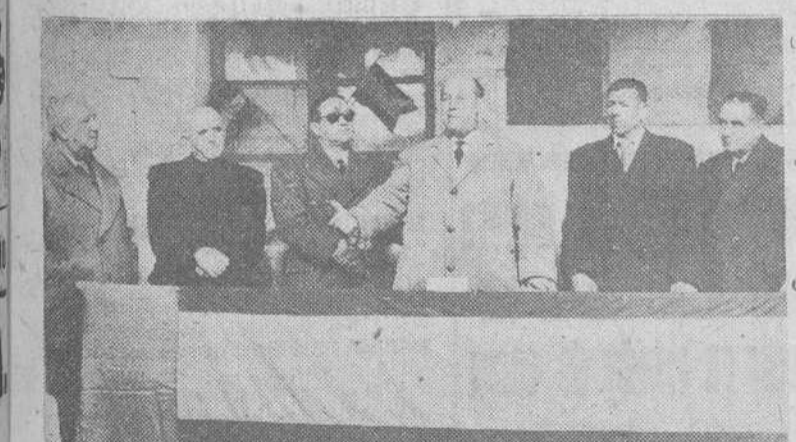
La entrega de títulos a los propietarios de nuevas parcelas en Torrepadre, fue presidida por las autoridades. En la foto, el señor gobernador pronunciando un discurso

La constante preocupación de la CAJA DE AHORROS DEL CIRCULO por los intereses de la provincia burgalesa y el fomento de su riqueza agropecuaria hace que una de sus más destacadas actividades se oriente hacia el campo y sus problemas.