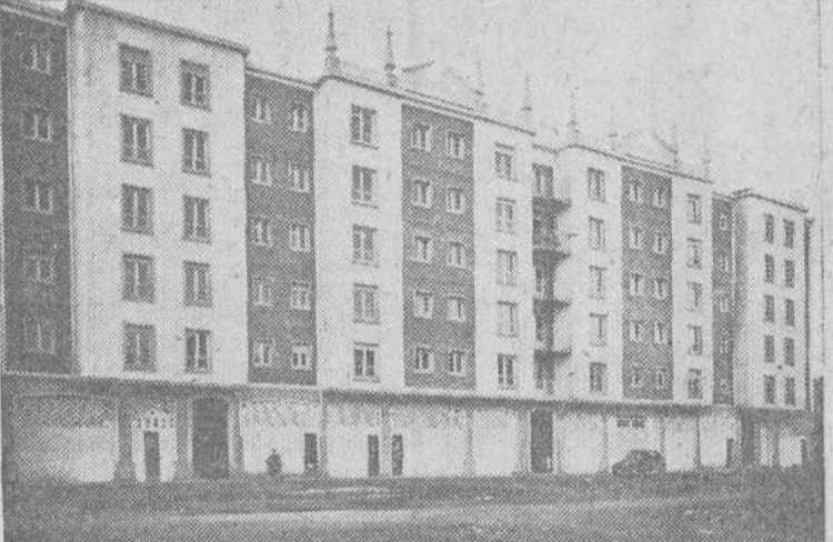
Magnífico grupo de viviendas construido en la zona de los Vadillos por la "Obra Social de la Vivienda Propia" de la CAJA DE AHORROS DEL CIRCULO

Próxima terminación de otro grupo de 200 viviendas en el sector de Zatorre