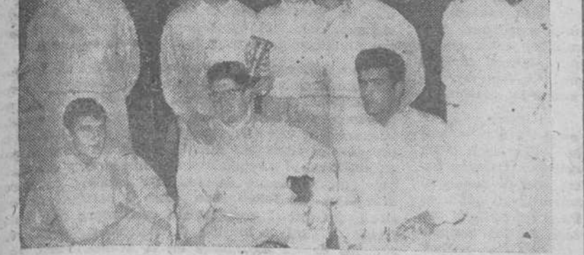
EL EQUIPO BURGALÉS DE GRECORROMANA QUE EL DOMINGO PASADO VENCIO BRILLANTEMENTE AL EQUIPO DEL CLUB ATOCHA DE MADRID.

Burgos venció a Madrid-Atocha en el encuentro de grecorromana