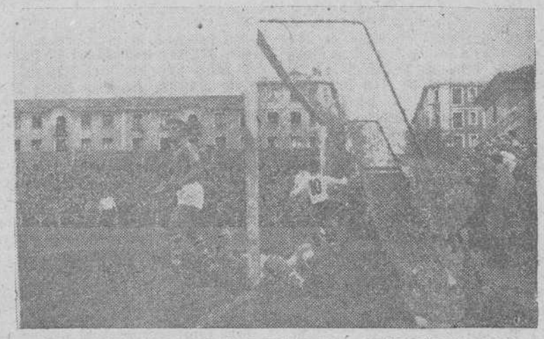
MOMENTO EN QUE FUE MARCADO EL SEGUNDO GOL DEL BURGOS. — (Foto "Fede")