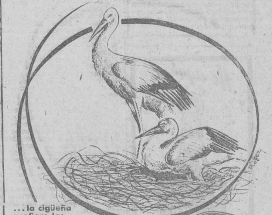
... la cigüeña prefiere las torres de campanarios.