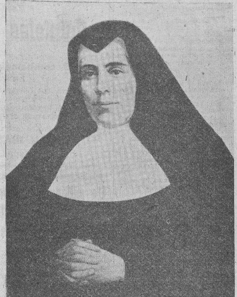
INGRESA EN EL CONVENTO DE CLARISAS DE BRIVIESCA

Pero no iban por allí las ansias de su alma. Dentro de sí, nota claramente vivos ardores de trabajar por la causa de Dios, de enseñarse más directamente en su servicio. Una vez varonilmente decidida a escuchar los arrollos del divino llamamiento, empezó a disponer para siempre en algún santo monasterio de rigurosa clausura.