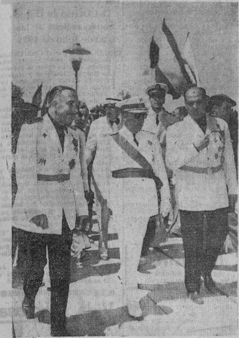
Madrid. — Su Excelencia el Jefe del Estado inauguró el nuevo Parque Sindical de Recreo de Educación y Descanso de Madrid, en el río Manzanares, con motivo de la festividad del 18 de Julio.

El Caudillo inaugura el parque sindical de recreo de Educación y Descanso