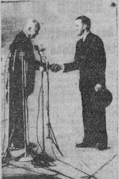
Ginebra. — El presidente de los Estados Unidos, a su llegada a Ginebra, es recibido por el presidente de la Conferencia Helvética, Max Petitpierre, en el aeropuerto.