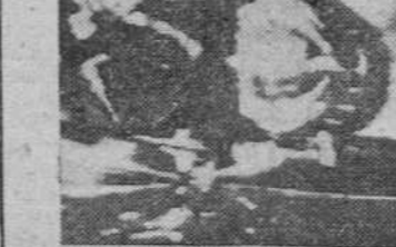
La Asunción (Paraguay). — El ex-presidente de la Argentina, Juan Domingo Perón, fotografiado en el automóvil que le trasladó desde el aeropuerto a la capital paraguaya. Le acompañan los miembros de su guardia personal.