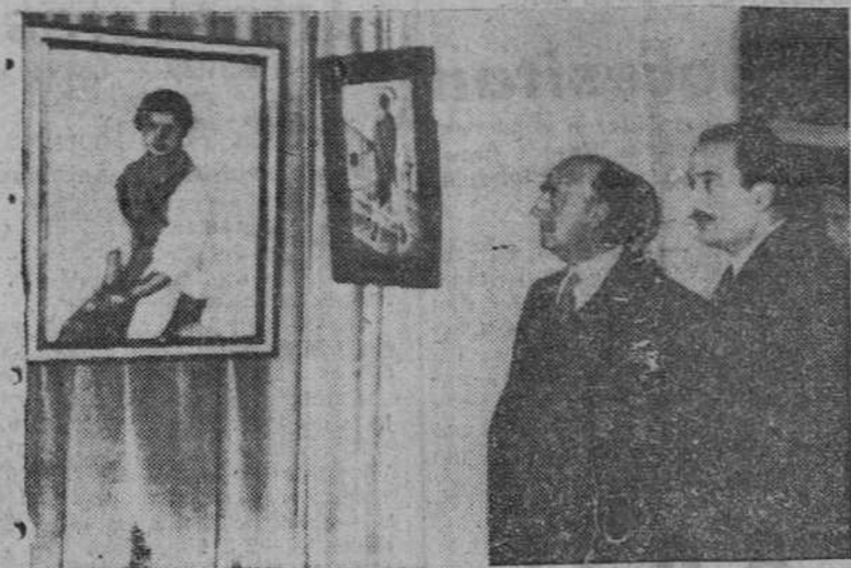
Barcelona. — S. E. el Jefe del Estado y las personalidades de su séquito durante su visita a la III Biera de Arte Hispano-Americano, que se celebra en el Palacio de Exposiciones de Montjuich.