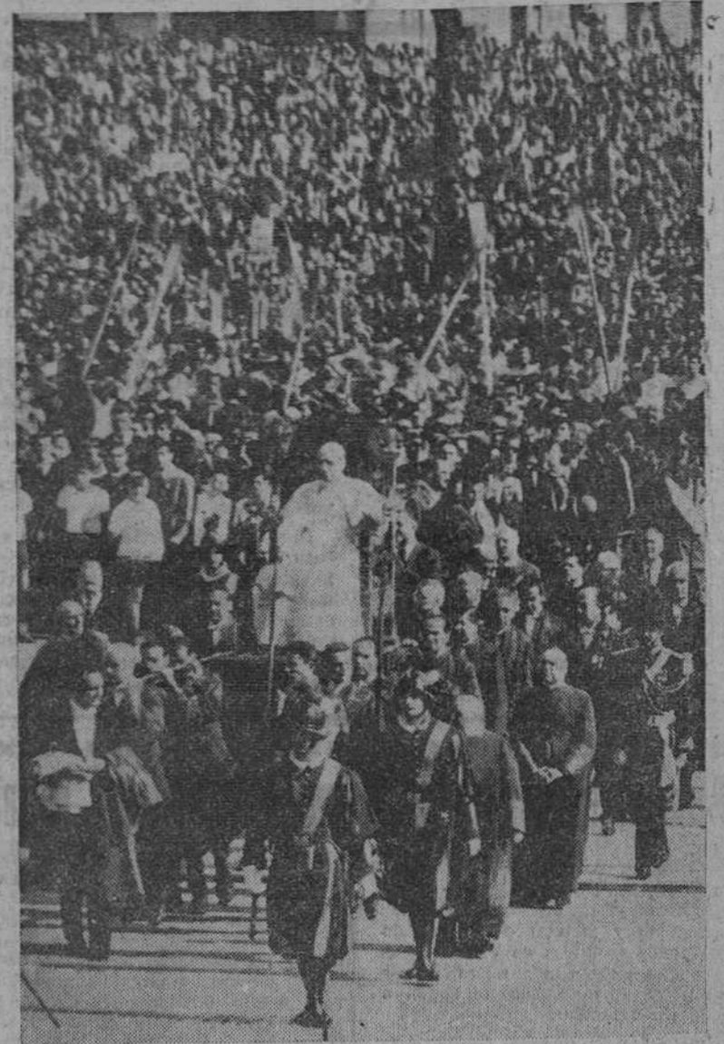
Roma. — El Santo Padre en su silla gestatoria, atraviesa la Plaza de San Pedro, durante la audiencia concedida a los deportistas, con motivo de cumplirse el X aniversario del Centro Sportivo Italiano.