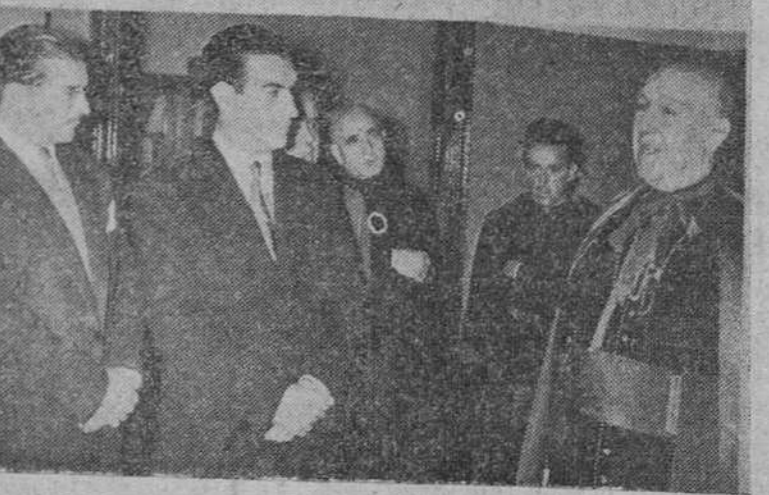
Cuatro documentos gráficos de los solemnes actos celebrados ayer en nuestra ciudad, en conmemoración de la fiesta del 12 de Octubre. Arriba, las autoridades que asistieron a la misa, organizada por el benemérito Instituto de la Guardia Civil, en honor de su Patrona, la Santísima Virgen del Pilar y las fuerzas del Cuerpo que asistieron al acto, desfilando al el Cuerpo de Correos solemnizó su fiesta patronal, en la iglesia del Carmen. A la derecha, el Excmo. y Rvdmo. Sr. Arzobispo, pronunciando unas palabras, tras bendecir el nuevo domicilio social de la Asociación Cultural Ibero-americana, que fue inaugurada ayer.