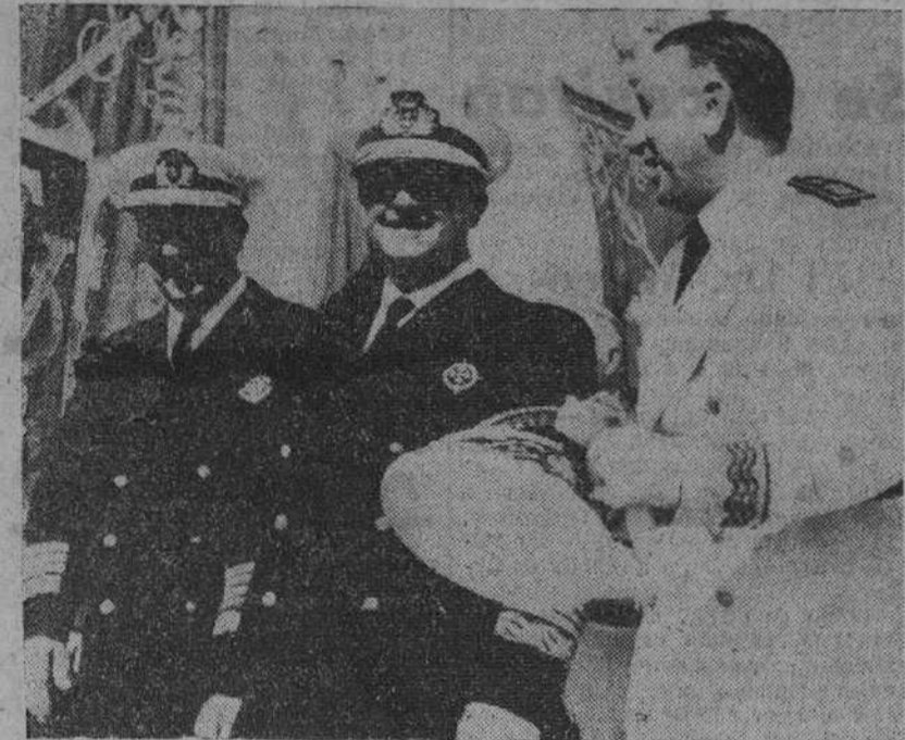
Ibiza. — S. E. el Jefe del Estado, con los ministros de Marina y Justicia, durante el acto de entrega de las llaves a los beneficiarios del grupo de viviendas "Santa Margarita".

Representantes de todos los pueblos hispánicos y E. E. U. efectuaron una ofrenda de flores ante la estatua de Colón