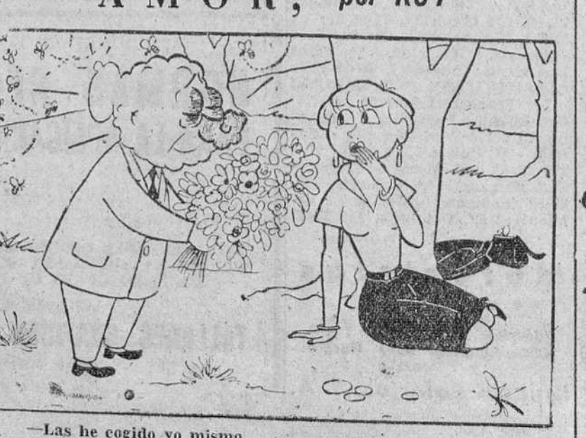
—Las he cogido yo mismo.