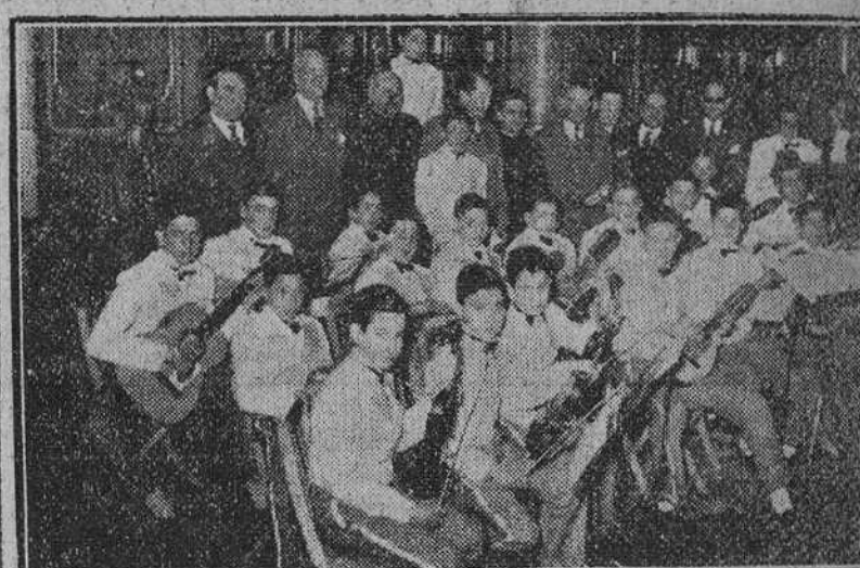
A mediodía de ayer, la rondalla del Colegio "Liceo Castilla", de los Hermanos Maristas...