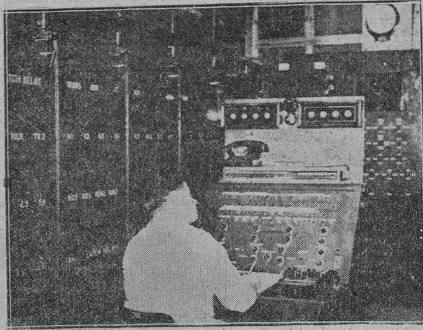
El ingeniero de control, ante el tablero de mandos de un "cerebro electrónico" de la Austin Motor Company, en Birmingham, que controla la llegada a la cadena de montaje de piezas acabadas, como neumáticos, motores y chasis.

De este modo, paso a paso, pero con una rapidez mucho mayor que la que se podría conseguir con personal humano, el cerebro automático controla cada una de las unidades de la fábrica que dirige, y produce piezas perfectamente acabadas con un margen de error de cinco micrones.