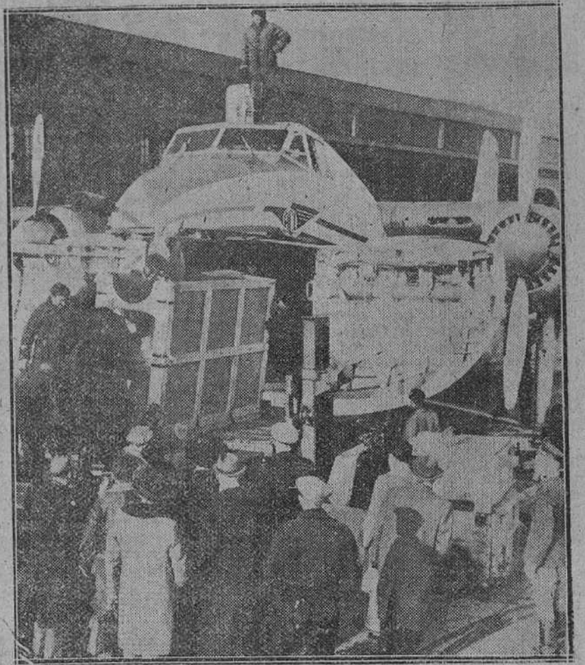
Berlin. — Un momento del desembarco en el aeropuerto de esta capital, de los caballos del equipo hípico español, que participan en el concurso que se está celebrando en esta ciudad.