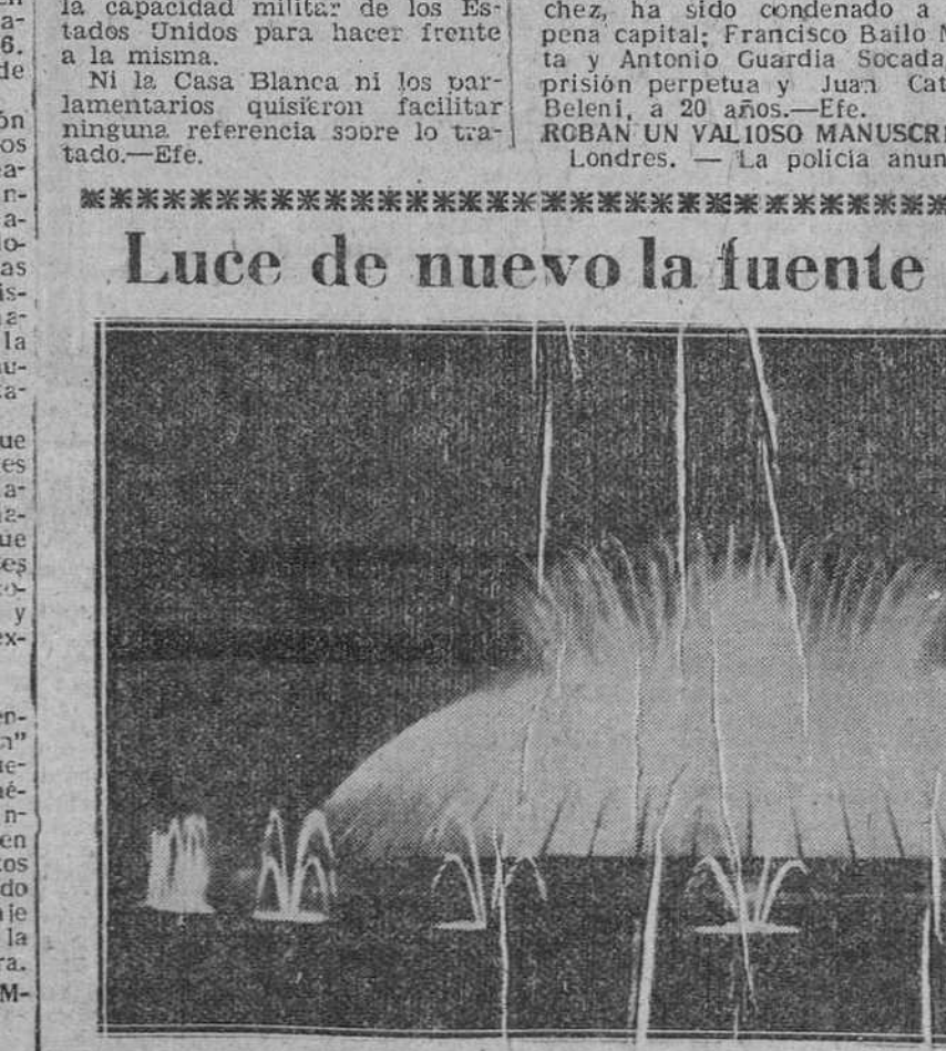
Barcelona. — Después de una reparación que ha durado casi un año, que además ha servido para ampliar sus maravillosos efectos de agua y luz, ha vuelto a funcionar el gran surtidor de Montjuich, aquel inabarcable alarde de luminotecnia de la Exposición Internacional de 1929. (Foto Gil del Espinar)

LUCE DE NUEVO LA FUENTE DE MONTJUICH Barcelona. — Después de una reparación que ha durado casi un año, que además ha servido para ampliar sus maravillosos efectos de agua y luz, ha vuelto a funcionar el gran surtidor de Montjuich, aquel inabarcable alarde de luminotecnia de la Exposición Internacional de 1929. (Foto Gil del Espinar)