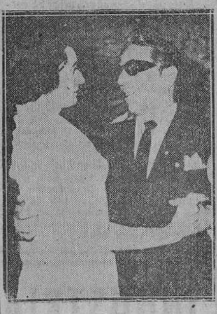
En el gran salón del hotel Semiramis, de El Cairo, Sócrates Onassis y Edda Mussolini, viuda de Ciano, fueron sorprendidos por el fotógrafo, mientras bailaban un tango.