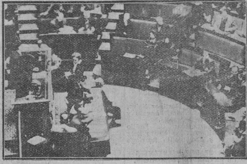
París.— Un momento de la intervención de Mr. Bardoux, republicano independiente, en la Asamblea francesa, en el debate sobre la política del Gobierno en África del Norte y durante el cual fue duramente criticado el primer ministro, Mendes France y algunos miembros de su Gabinete.