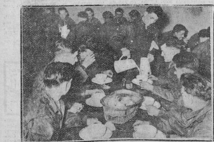
La decisión gubernamental francesa de absorber los excedentes de leche, ha entrado en su nueva fase con el reparto en todos los cuarteles del territorio, de raciones extraordinarias de leche a los soldados.