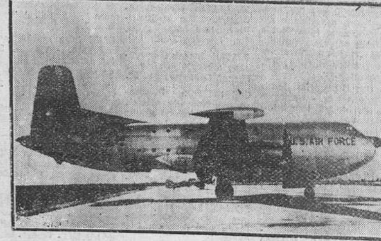
Ha pasado por el aeropuerto de Barcelona el avión de transporte más grande del Mundo, el cuatrimotor C. 124 "Globemaster", que puede llevar a bordo veinticinco toneladas de carga. En su interior tiene dos ascensores, que elevan cada uno de ellos hasta cuatro mil kilos. En tiempo de guerra puede ser transformado en avión-hospital, con capacidad para 136 literas. El gigantesco aparato, que mide 52 metros de envergadura y 38 de largo, pesa 87 toneladas y vuela a 480 Kms. por hora, con autonomía de 3.200 Kms.