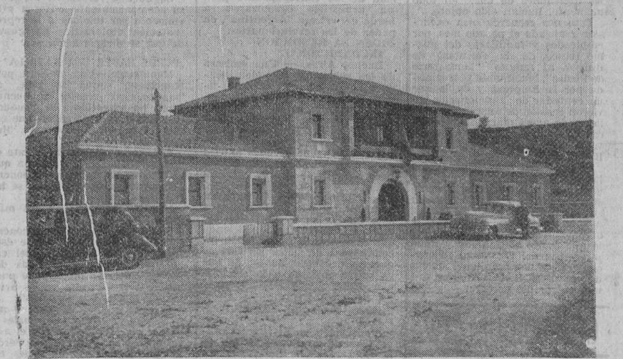
SOBERBIO EDIFICIO DEL AMBULATORIO DEL SEGURO DE ENFERMEDAD

PARA IMPORTANTE FABRICA TEXTIL Informes: "PUBLICIDAD CASTILLA". - Teléfono 28-54