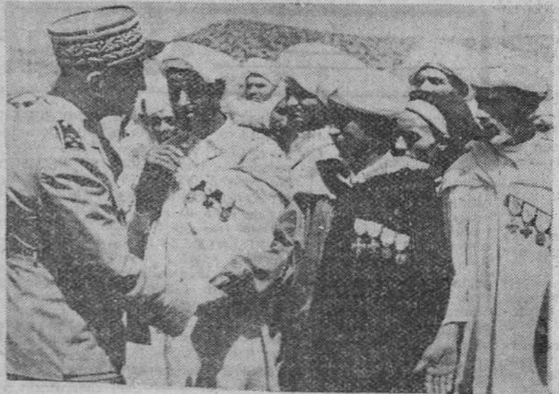
El residente general francés en Marruecos, ha asistido a la solemnidad del "Mussem", que cada año reúne a varios miles de miembros de la tribu de los Ait Seghouehene, en Skoura-el-Mers. El general Boyer de Latour conversa con los ex-combatientes de la tribu.

Paris. — Fuentes dignas de crédito afirman que el primer ministro, Edgar Faure, y el ministro de Asuntos marroquíes y tunecinos, Pierre July, han obtenido "carta blanca" para elegir libremente el tercer miembro del Consejo de guardianes del Trono para Marruecos. — Efe.