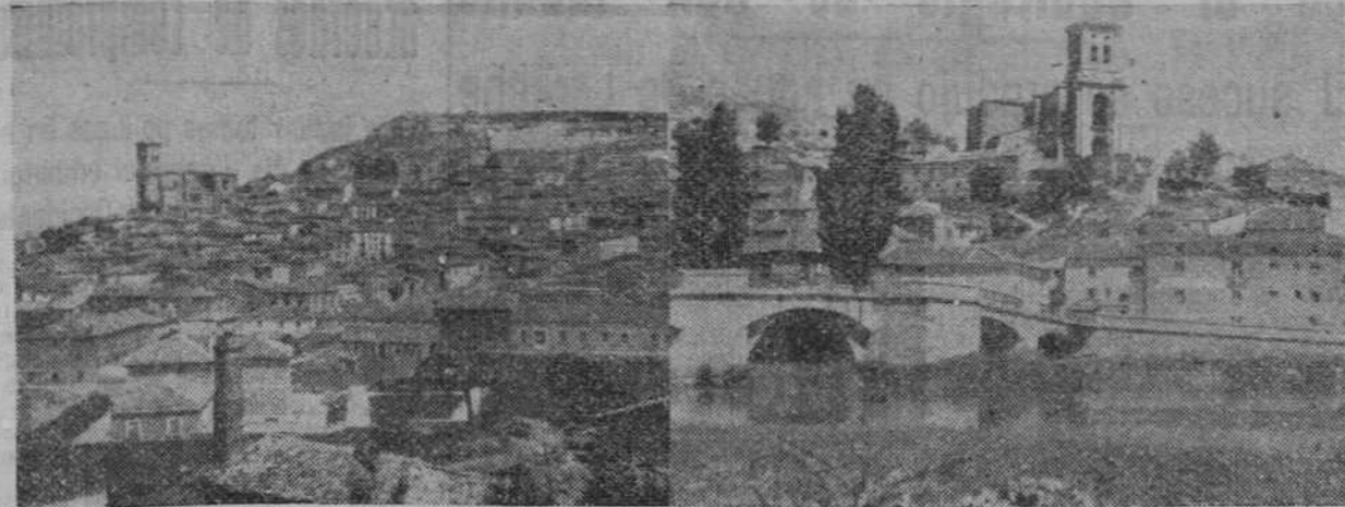
Dos bellas panorámicas de la histórica villa de Pampliega que hoy celebra sus tradicionales fiestas patronales