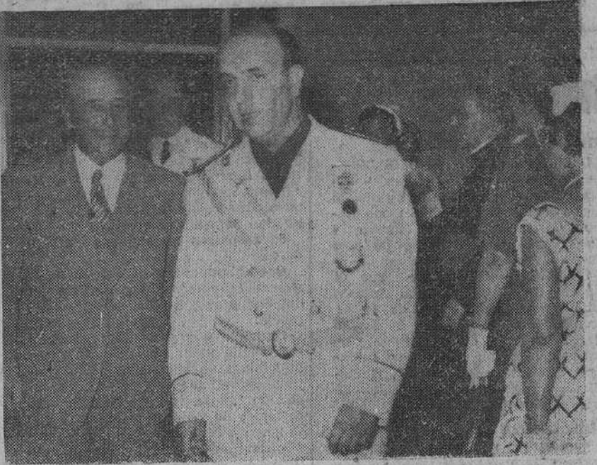
Vigo.—S. E. el Jefe del Estado acompañado de ministros y otras personalidades en la inauguración de la Residencia Sanitaria del Seguro de Enfermedad "Almirante Viena".

La Coruña.—A las doce de la mañana del domingo llegaron a Sobrado de los Monjes Sus Excelencias el Jefe del Estado, Generalísimo Franco y señora, doña Carmen Polo de Franco. Iban acompañados por el segundo jefe de la Casa Militar de Su Excelencia, y por el segundo jefe e intendente de la Casa Civil. En Sobrado de los Monjes fueron recibidos por el cardenal