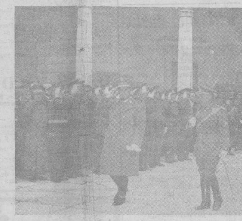
Toledo.—Con motivo de las bodas de oro de la XIV promoción de Infantería, a la que pertenece S. E. el Jefe del Estado, se celebraron en esta ciudad importantes actos conmemorativos de la efeméride. En la foto: Su Excelencia el Generalísimo a su llegada al Alcázar.