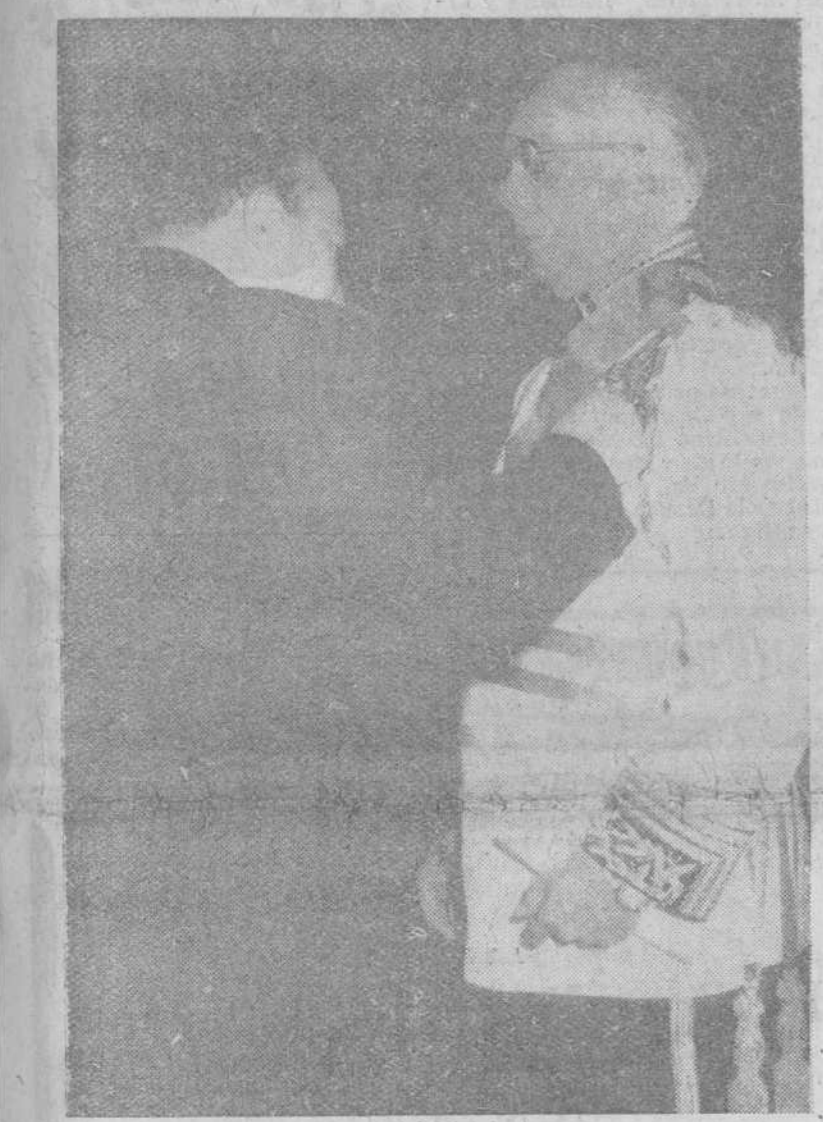
Ciudad Trujillo.—El ministro de Educación Nacional, D. Jesús Rubio, presidente de la Delegación española en el III Congreso Iberoamericano de Educación, que se está celebrando en esta ciudad, en el momento de imponer a S. E. el Generalísimo Trujillo, en nombre del Gobierno español, la Gran Cruz de Alfonso X el Sabio, que recientemente le ha sido concedida por su ferviente hispanismo.

La sesión plenaria de las Cortes empezó a las cinco menos cuarto, bajo la presidencia de don Esteban Bilbao. En el banco del Gobierno tomaron asiento los ministros subsecretario de la Presidencia, Asuntos Exteriores, Gobernación, Hacienda, Obras Públicas, Ejército, Marina, Aire y Trabajo.