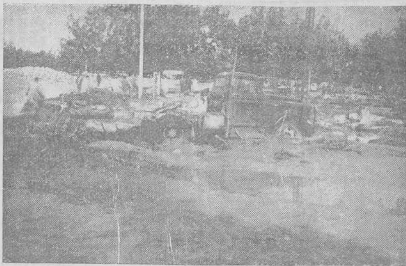
Valencia.—Charcos, cieno y destrozos de todas clases, testimonian la magnitud de la inundación que ya ha cedido al bajar las aguas de nivel.—(Foto «Cifra Gráfica»)

(Reportaje de la Agencia EFE por Juan SOLER PALMERO.—Prohibida la reproducción).