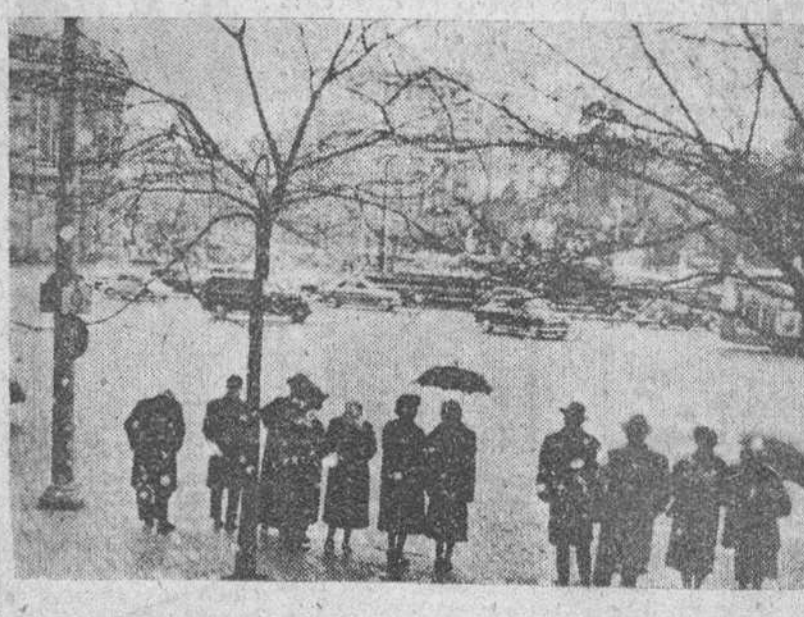
Madrid. — La primera nevada del invierno ha caído sobre Madrid, aunque el blanco manto no llegó a cubrir, cubriendo sólo los jardines. En la plaza de la Cibeles, la "cola" del autobús soporta estocadamente la nevada.

grados bajo cero. Ha nevado durante el día, casi sin interrupción y nu- (Pasa a cuarta página)