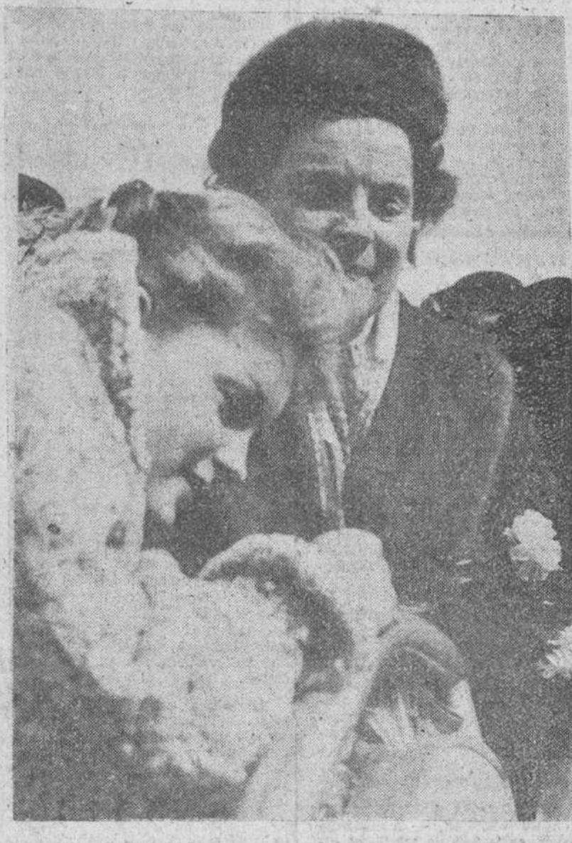
Madrid. — La celebre actriz alemana, Romy Schneider, interprete de "Sissi", llega a la capital española en un momento de su gira por España. La acompaña su madre, también famosa en el "Cine", Magda Schneider.