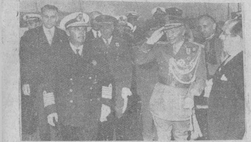
Barcelona. — S. E. el Jefe del Estado, acompañado del ministro de la Gobernación y las autoridades de la capital, momentos después de desembarcar del crucero «Canariass», en el puerto de esta ciudad.

Presidió el partido jugado ayer entre el equipo azulgrana y el Sevilla