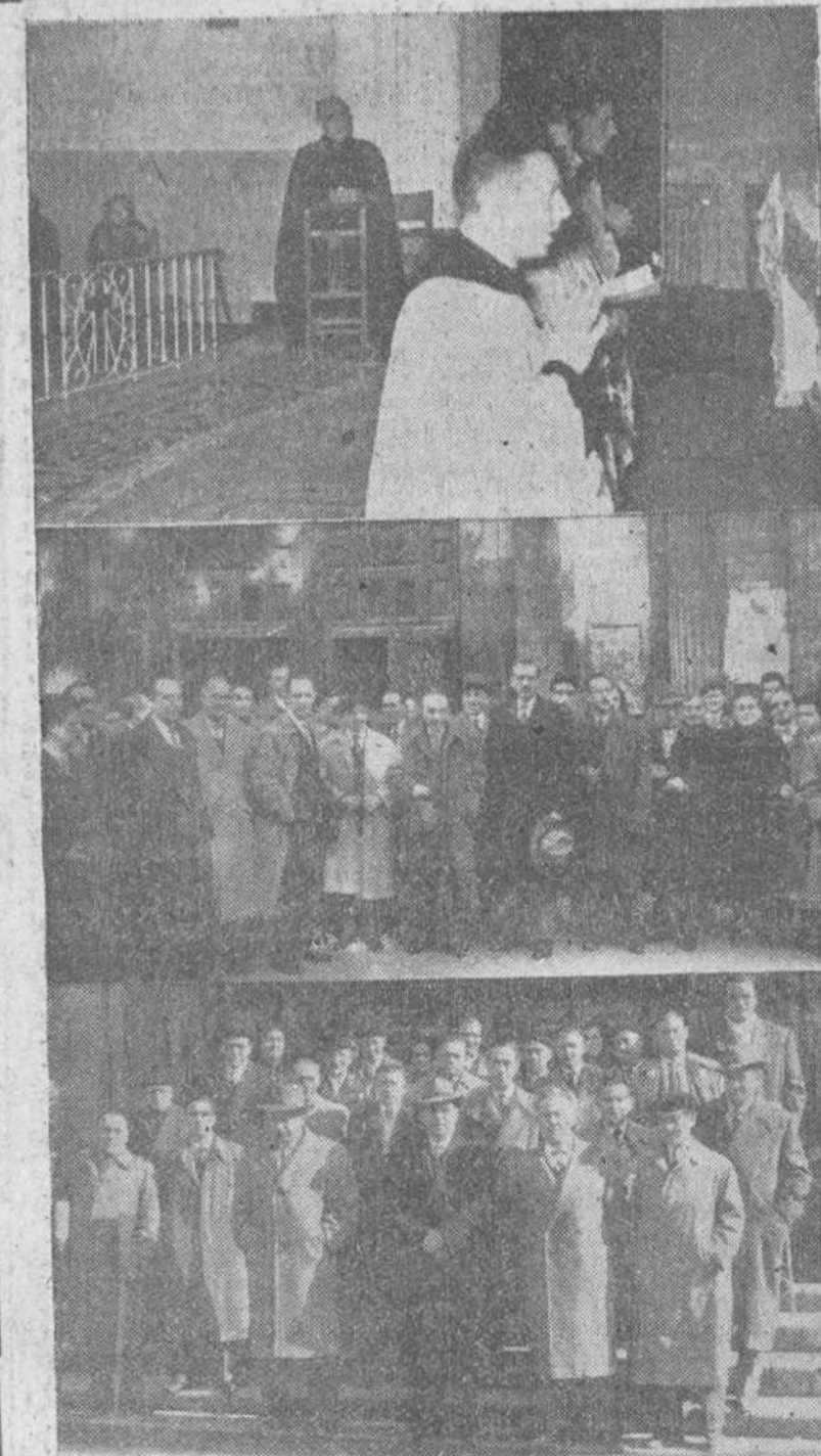
Con solemnes actos se celebró ayer en Burgos la festividad de San Juan de Dios, fundador de la Hospitalaria Orden que, en nuestra ciudad, cuenta precisamente con una institución de asistencia sanitaria.