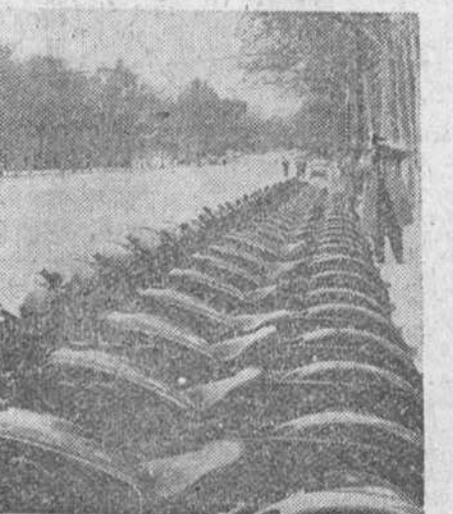
Madrid. — El alcalde de Madrid, conde de Mayalde, examina una de las cincuenta motocicletas que fueron entregadas a otros tantos motoristas que se incorporan a la plantilla de la Policía Municipal de Tráfico.