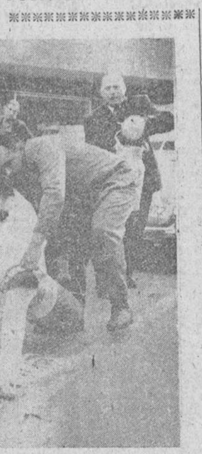
Zoschingen (Alemania). — Los campesinos de esta localidad próxima a Stuttgart derraman abundante cantidad de leche en las calles de la ciudad, como protesta por algunas disposiciones de las autoridades que les afecta perjudicialmente. La foto muestra a varios lecheros entregados entusiastamente al trabajo de verter la leche en una alcantarilla.

Ciudad del Vaticano. — Ha sido dado a la publicidad el «Motu Proprio» que comienza con las palabras «sacra Communion», en el que S. S. el Papa Pío XII, introduce nuevas modificaciones al ayuno eucarístico, simplificándolo. En el documento pontificio se dice: «Considerando los notables cambios que se han verificado en el orden del trabajo y oficios públicos y en toda la vida social, hemos creído oportuno atender a las continuas peticiones de los obispos y hemos dispuesto: Primero: Los Ordinarios de lugar exceptuados los vicarios generales sin mandato especial, pueden permitir diariamente la celebración de la Santa Misa por la tarde, siempre que así lo requiera el bien espiritual de un número considerable de fieles. Segundo: Los sacerdotes y los fieles están obligados a abstenerse durante tres horas de alimentos sólidos y bebidas alcohólicas y durante una hora de bebidas no alcohólicas, antes del sacrificio de la Santa Misa o antes de recibir la comunión. El agua puede tomarse libremente.