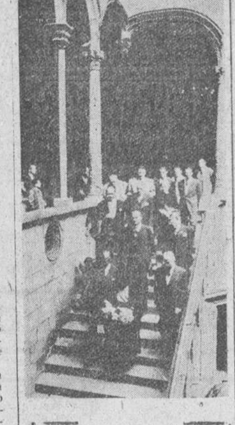
La esposa del presidente de Liberia, durante su estancia en Barcelona, ha visitado el Ayuntamiento y la Diputación, cuyas escaleras está bajando en la presente foto, acompañada de su séquito.

La esposa del presidente de Liberia en Barcelona