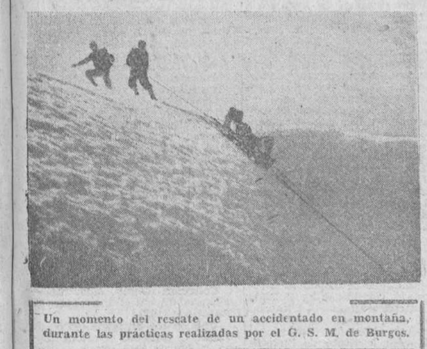
Un momento del rescate de un accidentado en montaña, durante las prácticas realizadas por el G. S. M. de Burgos.