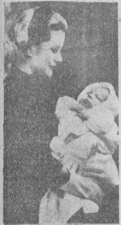
Mónaco. — La princesa Carolina de Mónaco presenta en sus brazos a la princesita Carolina, su hija, al pueblo monégaco desde uno de los balcones del Palacio. Esta ha sido la primera aparición pública de la princesita desde su nacimiento, en la víspera de su bautizo.