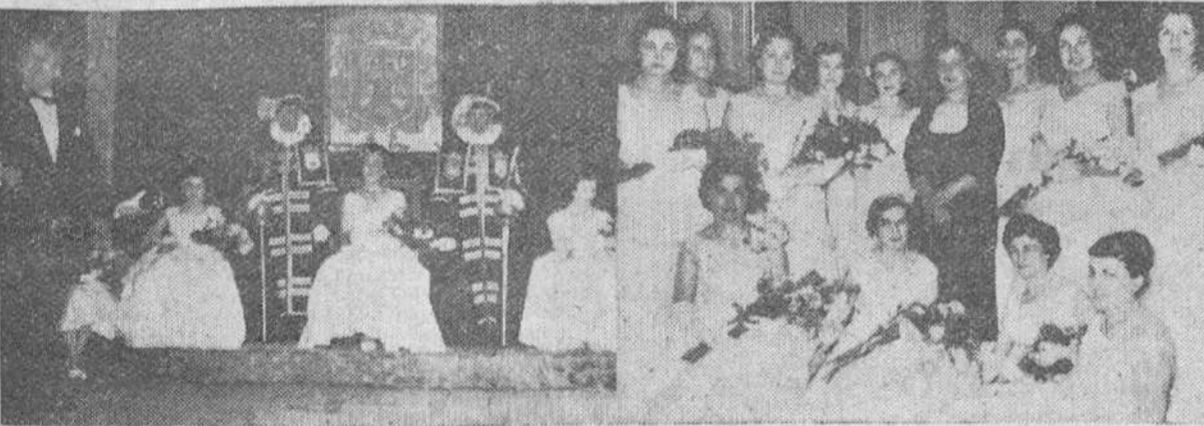
He aquí dos "fotos" obtenidas por "Fede" durante la celebración, en el "Casino" de la brillante "Fiesta de la Poesía" organizada por el "Rincón de los Poetas" del Círculo de la Unión.