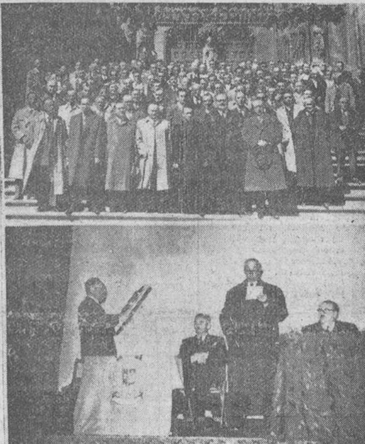
Con gran solemnidad celebró el domingo la Mutualidad provincial Agraria sus "bodas de plata" de su constitución. En nuestro grabado un grupo de concurrentes a la ceremonia religiosa, y un momento del homenaje tributado a los socios fundadores de dicha entidad.