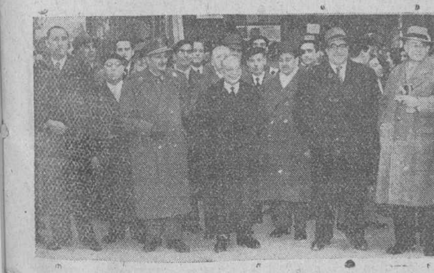
Grupo de agentes comerciales de nuestra ciudad fotografiados, con diversas representaciones, a la salida de la misa parroquial de San Lorenzo el Real, después de asistir a la misa celebrada con motivo de su fiesta patronal.