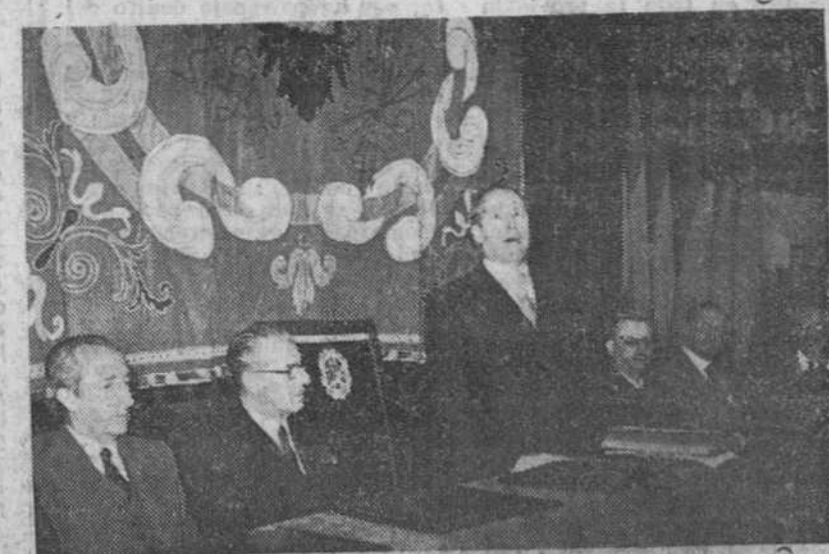
Madrid. — El ministro de Trabajo, Sr. Sanz Orrio, durante su discurso en el acto de inauguración del III Congreso de Medicina y Seguridad del Trabajo.