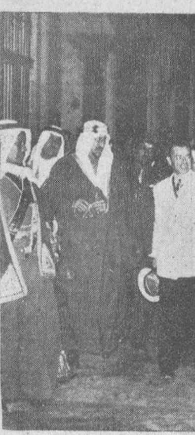
Córdoba. — S. M. Ibn Saud durante su visita a la Mezquita-Catedral de esta ciudad.